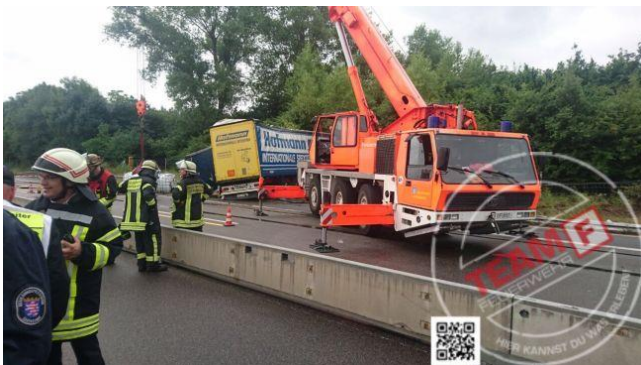
Verkehrsunfall BAB 3 mit Gefahrgut LKW