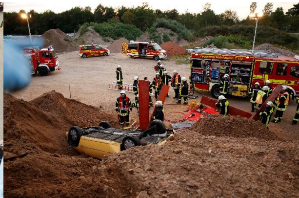
Tür Öffnungsseminar der Feuerwehren Mainhausen und Seligenstadt in Mainflingen