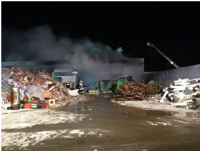
Brand in Entsorgungsbetrieb

Für diese Brandeinsätze wurden ca. 2500 Personalstunden erbracht. Allein auf den Einsatz am 25.10. entfallen fast 600 Personenstunden.