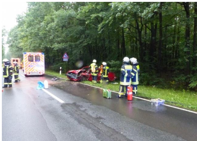
Verkehrsunfall L 3065