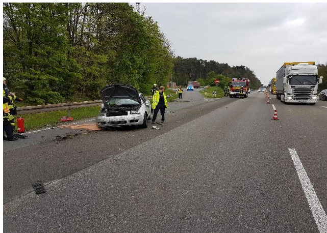
Verkehrsunfall BAB 3